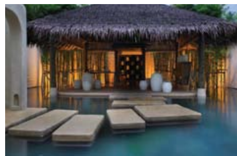
Chinese Spa Tea Room