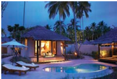
Beach Pool Villa

豊かな人生というコンセプトのもと、シックスセンス・デスティネーション・スパではゆったりとしたスペースに天然素材を使った調度品と上質なデザインで、ナチュラルな贅沢を満喫いただけます。21世紀のデスティネーション・スパとして、人生を豊かにするというシックスセンス・デスティネーション・スパのテーマを表現しています。