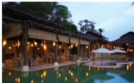
The Ton-Sai Restaurant

朝、昼、晩とオープンエアのトンサイ・レストランで、厳選された海の幸、高級魚介類を取り入れた菜食メニューをお召し上がりいただけます。